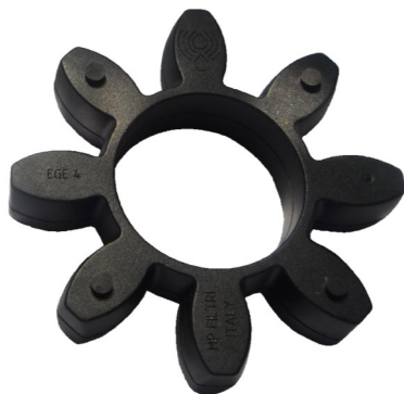
Внешний вид эластичной звездочки EGE