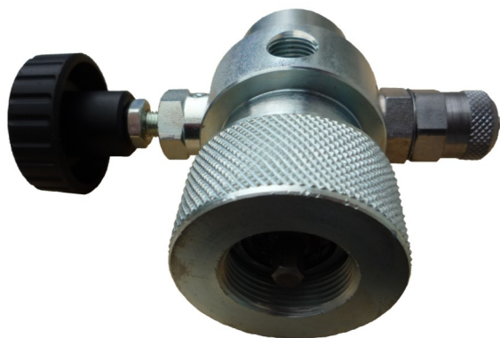
Внешний вид редукционного клапана