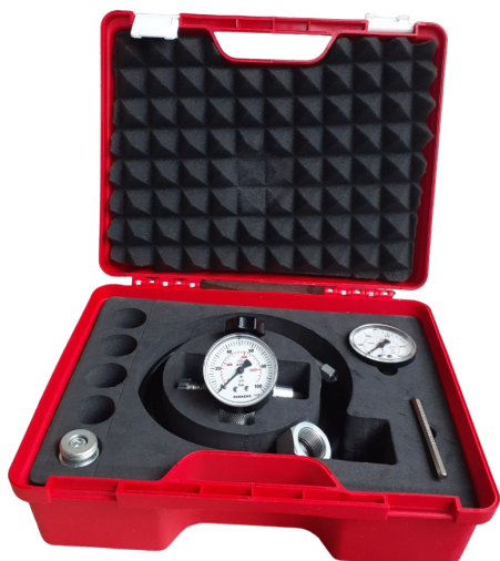
Внешний вид устройства AD1.2

Применяется для заправки (зарядки) азотом: мембранных гидроаккумуляторов с газовым клапаном M28x1.5 и баллонных гидроаккумуляторов с газовым клапаном 5/8"-18 UNF. P max =250бар, адаптирован для использования в России, температура эксплуатации -40...+80°C.